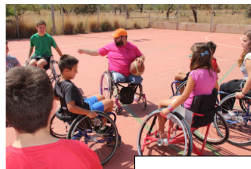
En Sant Jordi