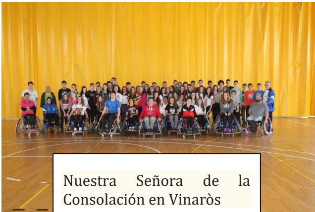
Nuestra Señora de la Consolación en Vinaròs