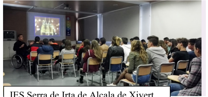
IES Serra de Irta de Alcala de Xivert