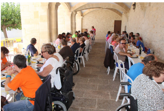
Jornada de convivencia Cocemfe Maestrat