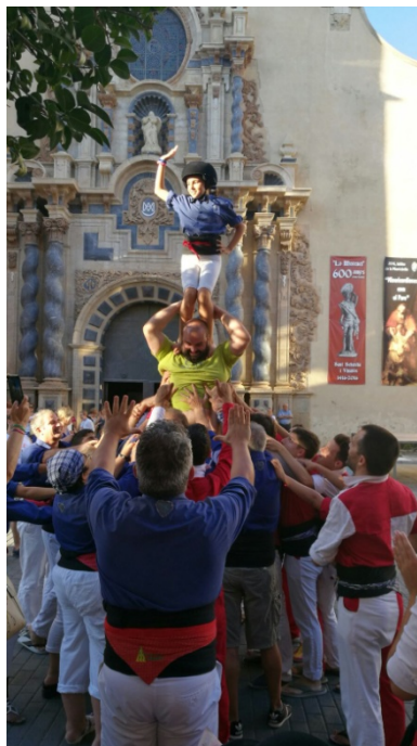
Jornada Inclusiva de Castellers i Muixaranga a Vinaròs