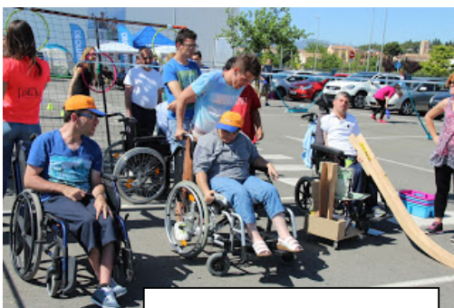
Decatlón de Tortosa