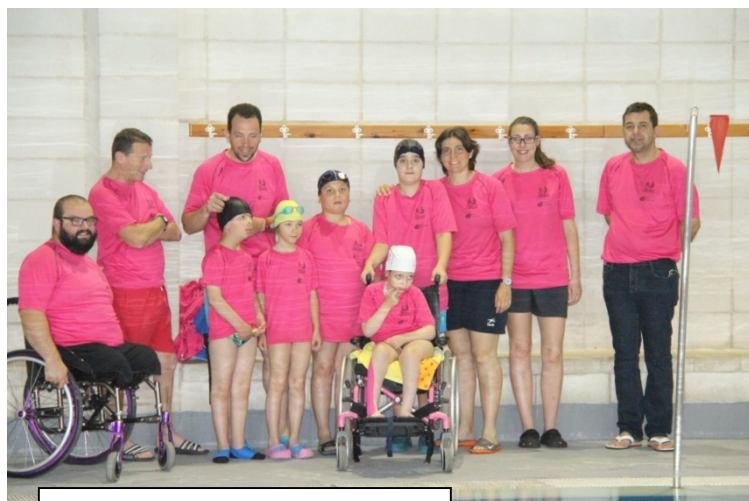
En la piscina de Vinaròs