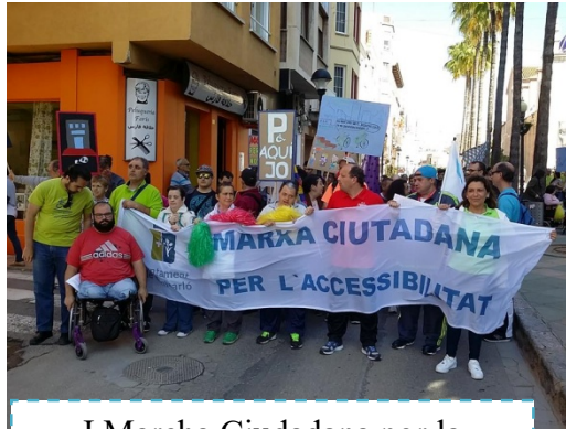
I Marcha Ciutadana por la Accesibilidad