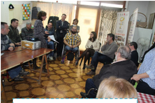
Visita Vicepresidenta de la Generalitat Valenciana