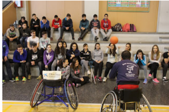
IES Politécnico de Castellón