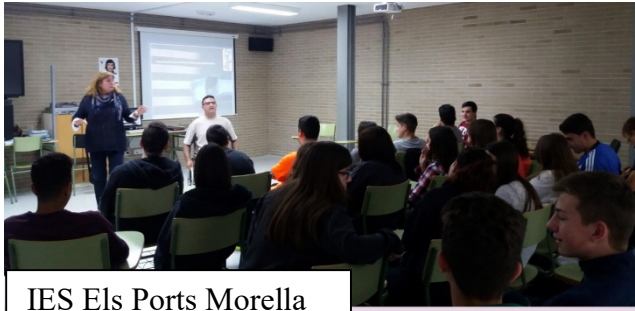
IES Els Ports Morella