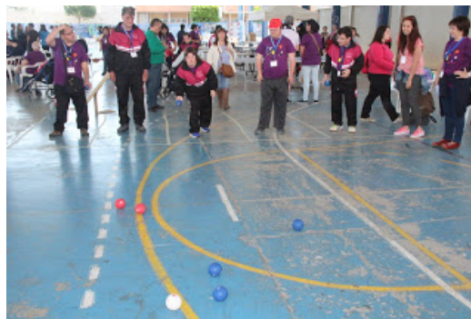
Imágenes de la jornada de convivencia y deporte adaptado