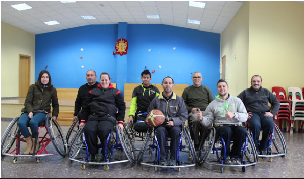
Curso de operaciones auxiliares en la organización y funcionamiento de instalaciones deportivas