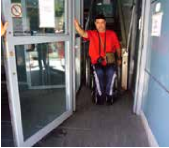
Detalle de la plataforma

Desde el colectivo se esta pidiendo desde hace tiempo la creación de la comisión del seguimiento del PLAN INTEGRAL DE ACCESIBILIDAD DEL MUNICIPIO DE VINARÒS; como que se cree una ordenanza Municipal de accesibilidad.