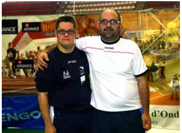
Algunos de los participantes del open de navidad