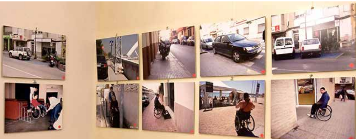
Fotografías de la muestra en la cafetería el cantonet

La exposición que se montó fue una pequeña muestra de “Trencant Barreres” de la colección de fotografías que los miembros de Cocemfe Maestrat han ido realizando durante los últimos años con la intención de ir denunciando públicamente la insolidaridad y el poco civismo de una gran mayoría de ciudadanos, que hacen caso omiso de las normas de circulación y un uso indebido de las plazas de estacionamiento reservadas a personas con movilidad reducida, así como de las barreras arquitectónicas que se encuentra las personas con discapacidades en el día a día.