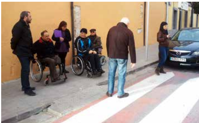
Miembros de Cocemfe revisando los puntos con necesidad de aplicación del plan de accesibilidad"

Realizará un diagnóstico de la ciudad desde la óptica de la accesibilidad con el objetivo de proponer soluciones a los problemas detectados. Se elaborará un mapa de la ciudad en el que aparecerán reflejadas las barreras existentes así como las actuaciones que se van a desarrollar para su eliminación.