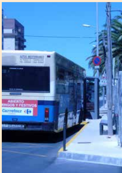
Fotos de la parada de autobuses de la Avenida Pio XII en Vinaròs no está adaptada: los bancos están mal ubicados y la acera es estrecha.

La última nota que quiero dejar plasmada es de la mala ubicación de la parada de bus que tiene la de la Avenida Pio XII, ya que apenas hay anchura para los usuarios de silla de ruedas eléctricas para subir al autobús y además esta operación se ve dificultada por la instalación del banco de espera de la marquesina, por lo que pido, a quien corresponda, mire de subsanar dicha deficiencia detectada en la parada de dicha avenida, gracias.