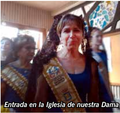
Entrada en la Iglesia de nuestra Dama