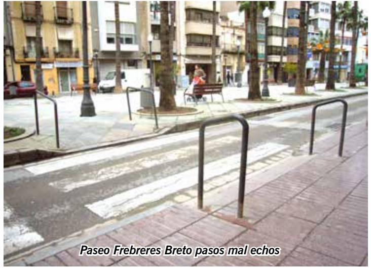
Paseo Frebreres Breto pasos mal echos

obras". En este sentido, recuerda Celma que cada año la Generalitat saca ayudas, aproximadamente hacia el mes de enero, para eliminar barreras por un importe de 30.000€, por lo que se ha pedido al Ayuntamiento que se pidan estas subvenciones que, completadas con las aportaciones que pueda agregar el mismo ayuntamiento, permitirían solucionar paulatinamente los problemas detectados en la redacción del plan...". Una vez más el objetivo es que "se cumpla la Ley de Accesibilidad en las nuevas obras y que los técnicos las supervisen bien y no pase como hasta ahora", y por supuesto, "que consulten con las asociaciones". En Benicarló, las prioridades vienen determinadas por los servicios públicos adaptados ubicados en el entorno del ermitorio de Sant Gregori. Unos aseos cuyas obras ya han empezado y que desde Cocemfe se confía en que "queden mejor el aseo adaptado del Pabellón Deportivo Municipal que no cumple con la normativa y que ya en su día se les dijo a los Concejales de Deporte y de Urbanismo, pero que a pesar de ello todavía no se ha solucionado el problema".