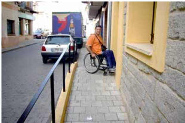
Puerta de acceso discapacitados Ayuntamiento Salsadella