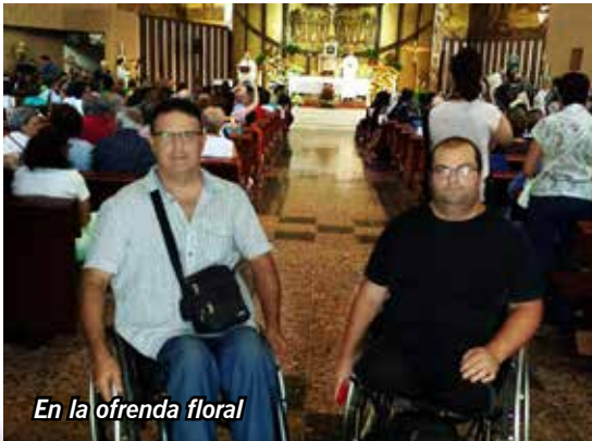
En la ofrenda floral