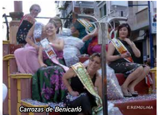
Carrozas de Benicarló