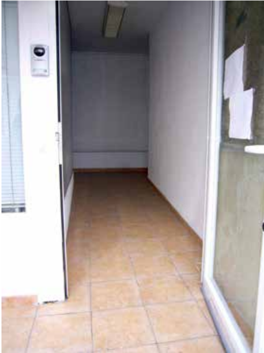
Ayuntamiento Vinaròs puerta lateral adaptada acceso al rellano