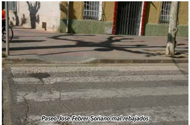
Paseo Jose Febrer Soriano mal rebajados