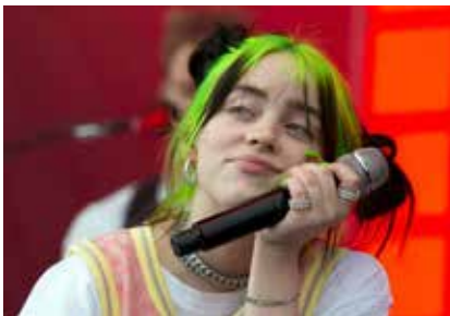
Billie Eilish, la joven estrella de la música que confesó padecer Síndrome de Tourette