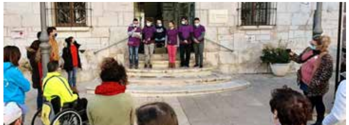
Lectura del Manifiesto del Día 3 de diciembre, Día Internacional de la Discapacidad