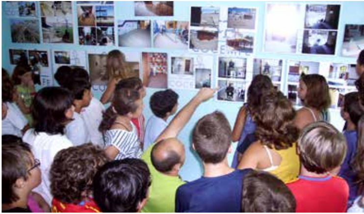
"La discapacidad no es una barrera" I Mostra fotogràfica i didàctica "Trencant Barreres" de Peñíscola