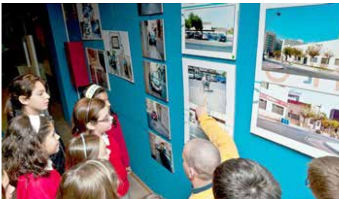
VI Mostra fotogràfica i didàctica trencant Barreres de Vinaròs