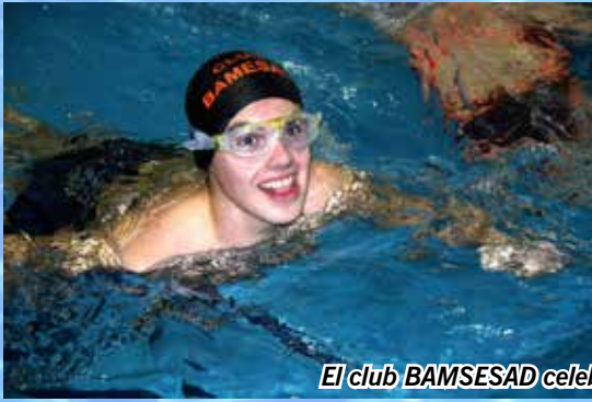
El club BAMESAD celebró el Open en Onda