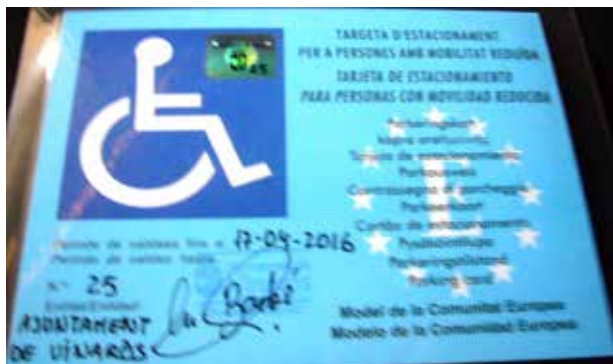
Tarjeta donde se puede ver el anagrama

proponiendo a las administraciones públicas actuaciones para asegurar que las plazas reservadas sean utilizadas por las personas que cumplen los requisitos para ello, como la incorporación del holograma en las tarjetas que decidió hace unos meses el Ayuntamiento de Valencia y que en el de Vinaròs también recogió nuestra petición de poner el anagrama en la tarjeta y que actualmente ya se han cambiado todas las tarjetas por la nueva con anagrama, y que las tarjetas se revisaran cada cinco años y no cada diez años como hasta la fecha se revisaban.