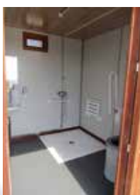
La platja té també instal·lacions noves amb dutxes i canviadors totalment adaptats