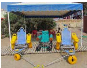
Hi ha dos tipus de cadires amfibis