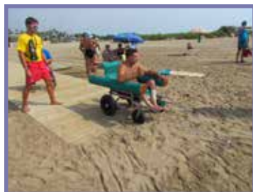
Les cadires amfibis faciliten l'accés a l'aigua